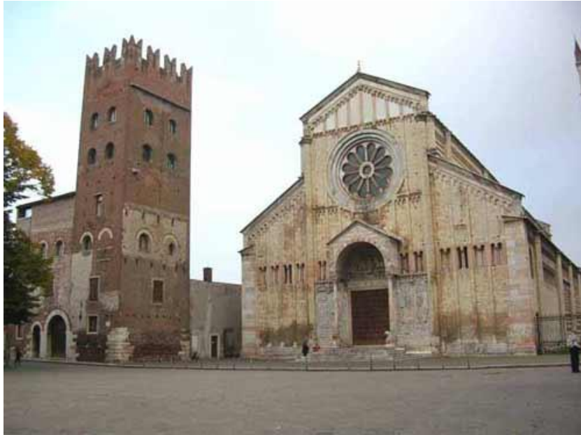
Basilica romanica di San Zeno a Verona costruita principalmente tra XI e XII secolo