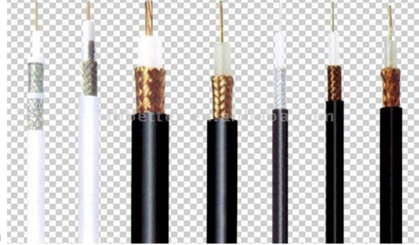
صورة توضح مجموعة كوابل محورية