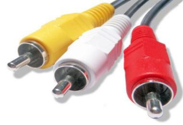
صورة توضح كابل مزدوج نقل الصوت والصورة